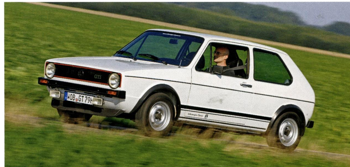
VW GOLF GTI

Endlich hat die Szene erkannt, dass schon viel zu viele Fahrzeuge dem Rost oder allzu dynamischen Fahrern erlegen sind oder die Autos selbst im Rahmen von aufwendig durchgeführten Restaurierungen nicht mehr in den Originalzustand versetzt wurden. Frühe Exemplare mit Metallstoßstangen und Vierganggetriebe sind mittlerweile eine echte Rarität. ■